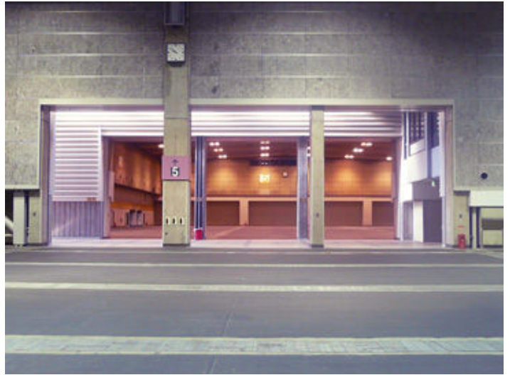
① 5号館と連結して使用する場合 When using with Hall 5