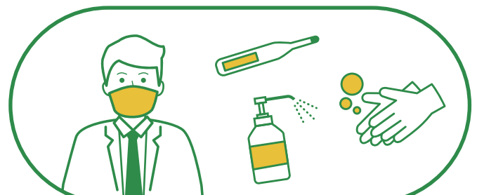
スタッフの健康管理、入館時のアルコール消毒、手洗い、 うがい、マスクもしくはフェイスガードの着用