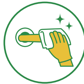
人が触れる箇所を 抗菌・消毒清掃