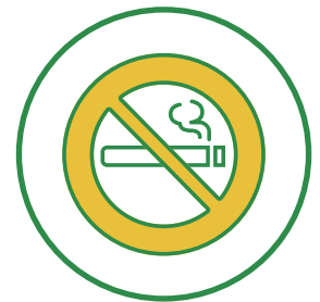
蜜を避けるため 喫煙所を閉鎖