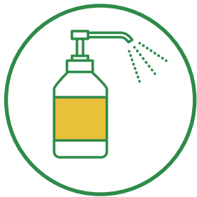
各所に アルコール消毒液を設置