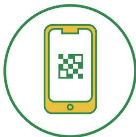
大阪コロナ追跡システム 導入