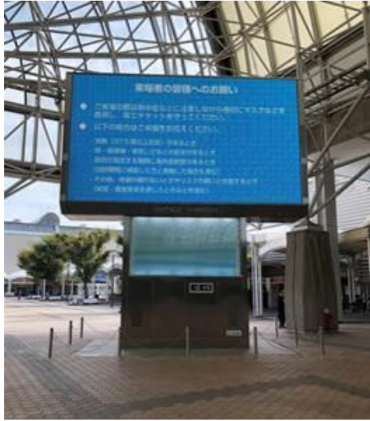
【展示会の様子（2020. 10. 28～30 ファベックス関西 2020）】