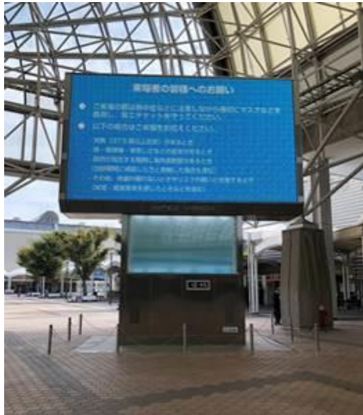
【展示会の様子（2020. 10. 28～30 ファベックス関西 2020）】